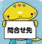
岐阜県「社会キャラクター」 ともにん