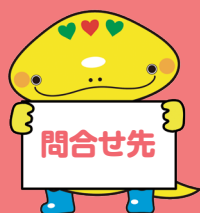
岐阜県「社協キャラクター」 ともいん