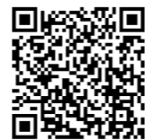
Ang QR Code ay rehistradong trademark ng DENSO WAVE INCORPORATED.