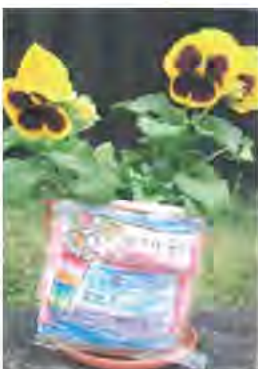
▲令和3年4月 子どもたちのメッセージカード付鉢植

少子高齢化が進む現在、必然と騎馬戦型から肩車型に移行するのは、それほど遠くはない。今必要なことは高齢者と若い人の関わる行事に時間をかけることであり、民生児童委員はその架け橋になればと思います。