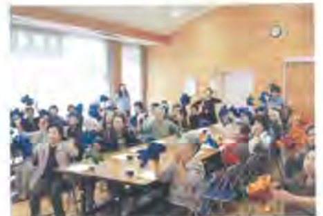
▲大畑公民館ふれあいサロンの様子

また、コロナ禍においては、この4月から各地域で20名程にて月一回のサロンを開催しているところもあり、数時間でも楽しい時を提供できれば本望です。