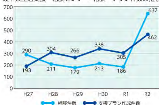
表1 岐阜県生活支援・相談センター 相談・プラン件数の推移

談件数」の約1.5倍となる300件前後で推移かつ増加傾向にあり、課題の解決に時間が必要となるケースが増加しています。