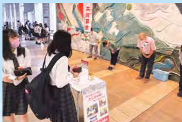
多治見市・JR多治見駅