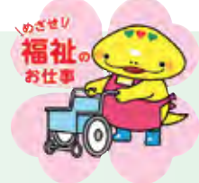
岐阜県「社協マスコットキャラクター」ともにん