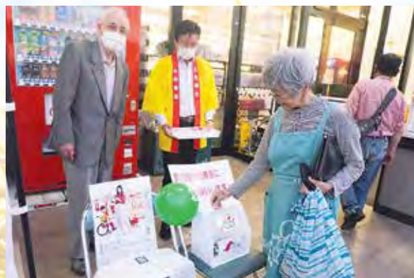
瑞浪市・パロー瑞浪中央店