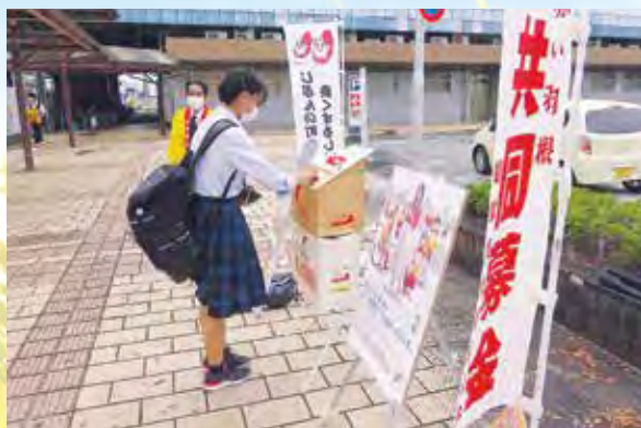
羽島市・JR岐阜羽島駅