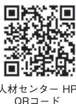
HP QRコード 人材センター

県内求人事業所を対象に、事業所の魅力発信セミナー(オンライン開催)の形で、人材定着の好事例からその秘訣を学ぶ機会を設けました。