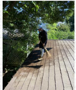
施設での雨樋の詰まり掃除