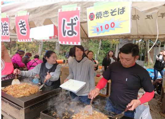
イベントでの焼きそばの屋台出店