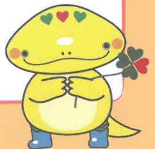
岐阜県「社協キャラクター」 ともにな

社会福祉法人 岐阜県社会福祉協議会 岐阜県成年後見・福祉サービス利用支援センター