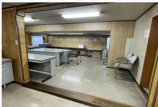
サロン時に使用されている会社事務所

*民生委員…厚生労働大臣から委嘱され、その地域において常に住民の立場に立って相談に応じ、必要な援助を行う地域福祉を進める人