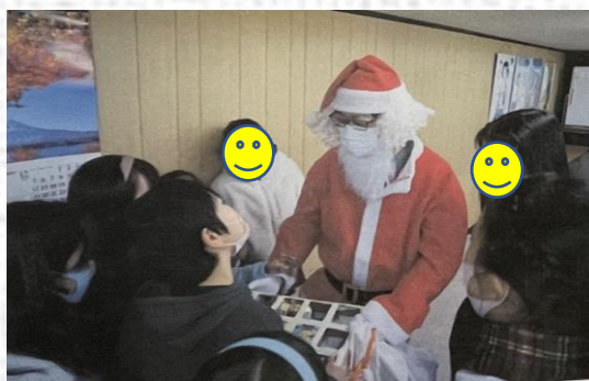
クリスマス会の様子