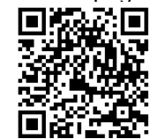
O código QR é uma marca registrada da DENSO WAVE INCORPORATED.