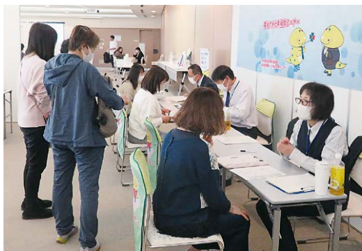
たくさんの求職者や相談者で賑わう福祉のお仕事フェア

また、キャリア支援専門員は求職者の円滑な就労・定着を支援するため、センター来所者等の他、県内11箇所のハローワークにて個別に求職相談を行っており、求人事業所を訪問し、求人動向を把握しながら、一人ひとりに合った職場探しや、働きやすい職場づくりに向けた相談・助言にも取り組んでいます。