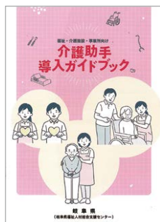
介護助手導入ガイドブック

介護助手とは、定年後の高齢者や未就労の女性や学生など、掃除やベッドメイキング等の介護関係の資格がなくても担うことができる業務を担当する人材です。介護助手を導入することで、介護職員が専門性の高い介護業務に専念できる環境づくりを目指しています。