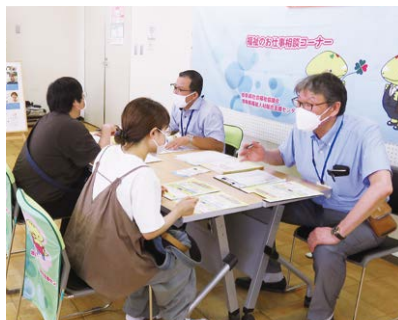
キャリア支援専門員による就職相談

岐阜県福祉人材総合支援センター（以下「センター」という）は、福祉人材の総合支援拠点として、無料職業紹介・相談を行っており、求職者の相談対応や希望に合う福祉・介護事業所の紹介だけでなく、キャリア支援専門員が、求人事業所とのマッチングや、資格、働き方、職場選びなど就職に向けたアドバイスを行っています。